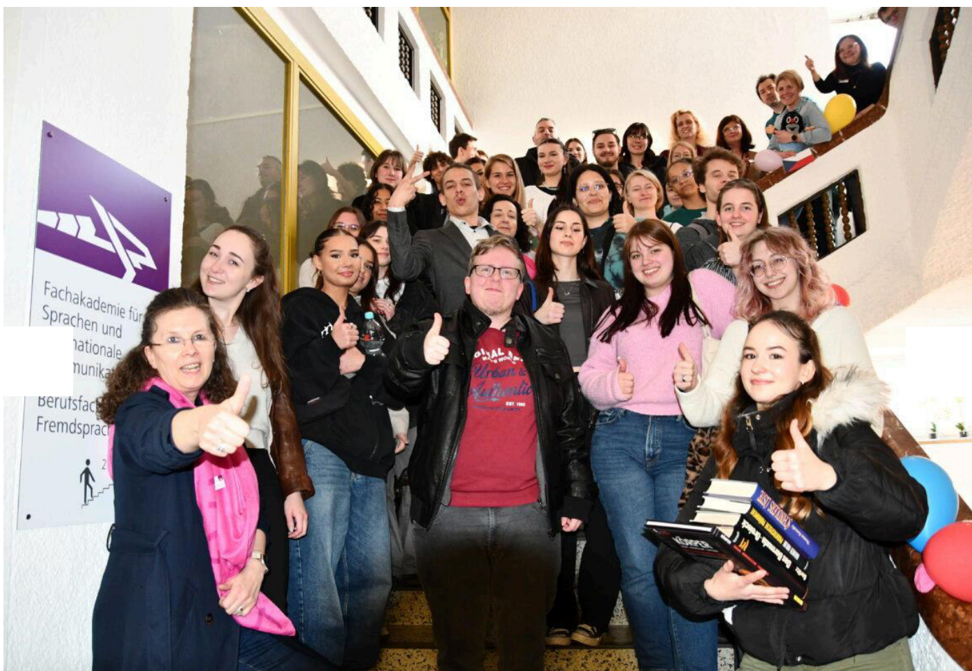
Schülerinnen, Schüler und Dozenten begrüßten die Besucher.